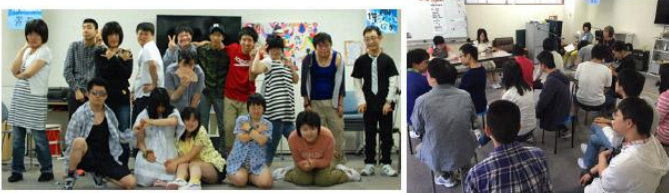
サマーコレクションは少し肌寒い日でしたがとても盛り上がりました。