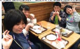
卒業生の先輩から仕事などの話を聞きました。元気づけてました。